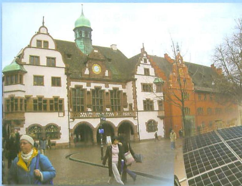
▲フライブルク市庁舎